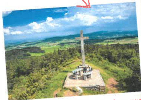
Découvrez le parcours d'orientation du Vernet