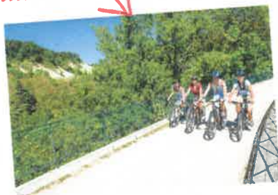
Via Fluvia 3km Gare de Bessamoret